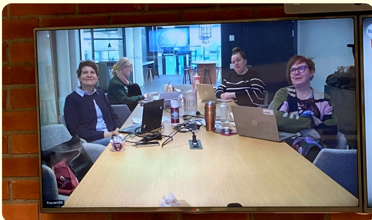
Kuva 1 (yllä) ja kuva 2 (alla): tilannekuvia TAISTO24 harjoituksesta

Marraskuussa 2024 harjoitteluryhmän muodostivat kaksi (2) hallituksen jäsentä, neljä (4) henkilökunnan jäsentä ja tietosuojavastaava. Harjoitustehtäviä oli tällä kertaa ryhmitelty ja suunnattu tietyille osastoille kuten IT-osasto, viestintäsektori, pääsektori, lakiosasto, HR-osasto ja ulkoiset kumppanit.