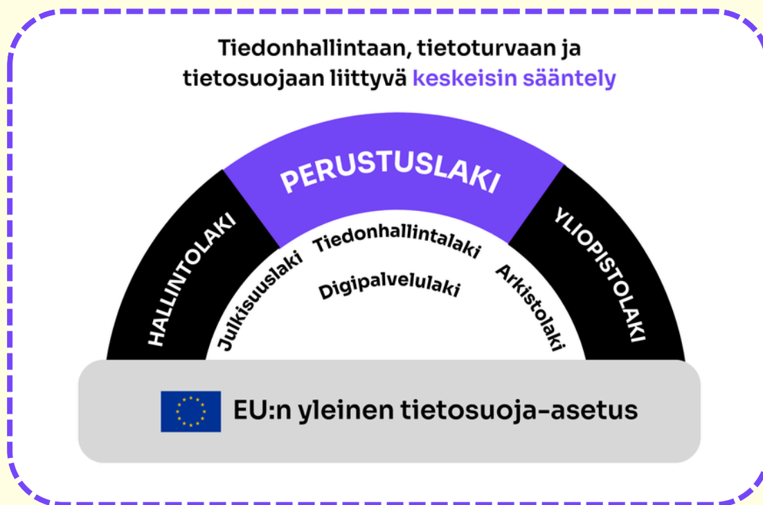
Kuva 1. ISYYn tiedonhallintaan, tietosuojaan ja tietoturvaan vaikuttava keskeisin sääntely.

Ylioppilaskunnan tiedonhallintaan, tietoturvaan ja tietosuojaan vaikuttava sääntely koostuu useista eri säädöksistä, joita tulee tulkita rinnakkain. Keskeisin sääntely on kuvattu seuraavassa kuvassa.